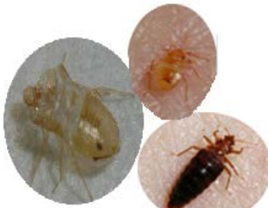
These images are not to scale

لون حشرات بق الفراش الكبيرة هو البني المحمر ويبلغ طولها حوالي 1/4 إلى 8/3 انش، ويبلغ عرضها مثل طولها تقريبا. وحجمها تقريبا كحجم بذرة التفاح. بق الفراش لا يمتلك أجنحة، و لا يمكنه الطيران. كما و يمكن لهذه الحشرات أن تتحرك بسرعة كبيرة على الأسطح الأفقية والرأسية على حد سواء.