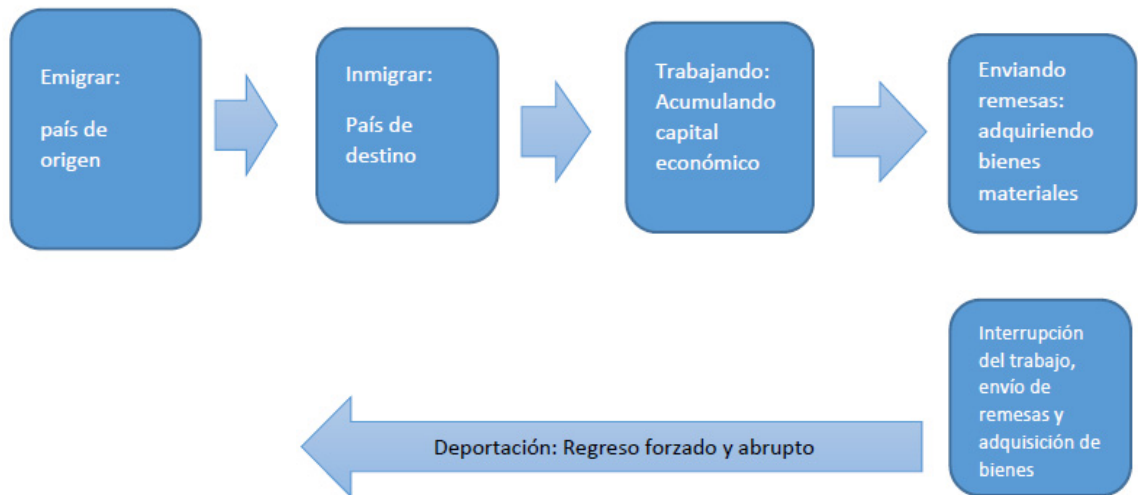
Figura 2: La interrupción del proceso de migración

En el siguiente esquema (fig. 2) presento la interrupción del proceso de migración: