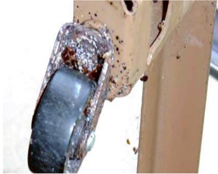
检查床架查看是否有臭虫存在的迹象

先从家具的可视区开始。沿着所有边缘、角落和挂架寻找。仔细检查家具细节之处和所有的缝隙。移动家具,使其离开墙壁,然后检查家具背面。仔细检查背板的缝隙和所有螺丝孔。