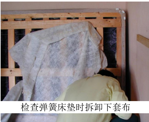
检查弹簧床垫时拆卸下套布

重复这一寻找步骤, 检查弹簧床垫。唯一的不同是弹簧床垫通常具有塑料边缘保护和一种叫做“套布”的疏松织物安装在底侧。弹簧床垫上的这些边缝和边缘是臭虫藏匿的最常见地方。为了确定弹簧床垫内部没有臭虫, 您应卸下套布, 并检查床垫内部的木头、裂缝和缝隙以及螺丝孔。检查之后, 将套布重新安装上, 恢复原样。