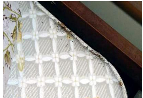
沿着床垫边缘和角落查看是否有臭虫出现的迹象

先从床开始, 包括床垫、弹簧床垫和床架。先检查可视区。沿着边缘和角落查看。还要沿着所有缝线和床垫标签检查。当床垫放置在床上时, 可以检查床垫的五个面。检查完上表面之后, 您可以将床垫立起, 检查床垫底面。